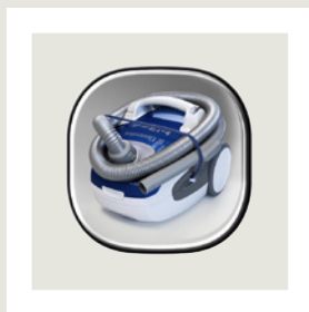
Rangement du flexible